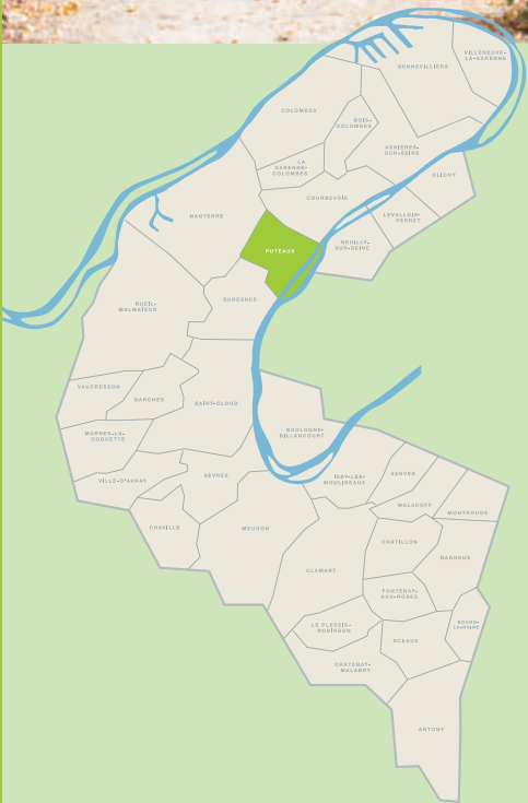
Les bords de Seine